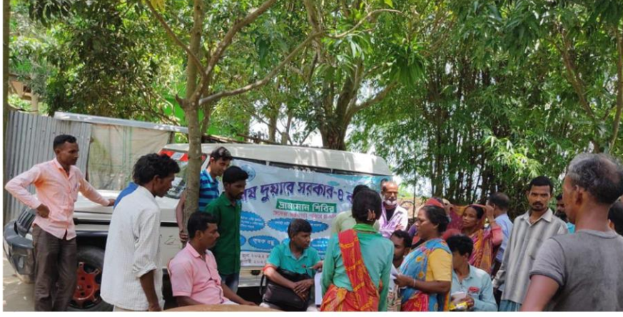
হেমতাবাদ ব্লক, উত্তর দিনাজপুর