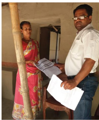
কুমারগঞ্জ, দক্ষিণ দিনাজপুর