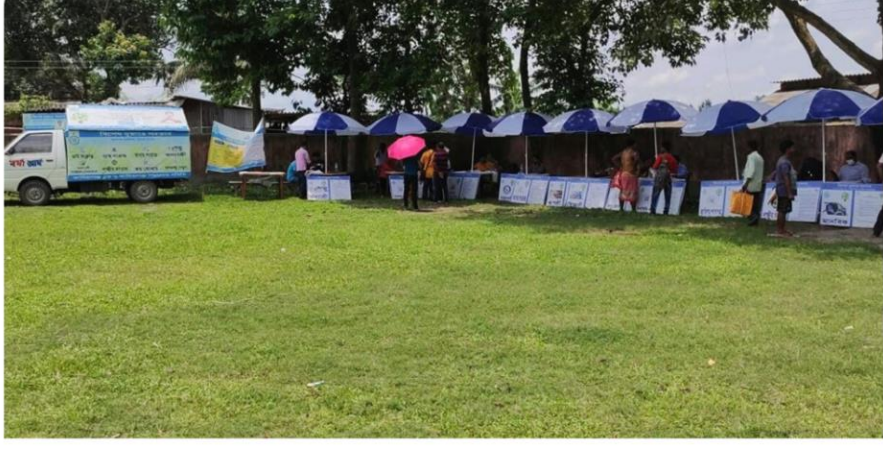
কালিয়াগঞ্জ ব্লক, উত্তর দিনাজপুর