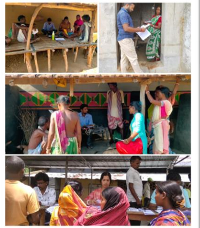
মানবাজার ১ ব্লক, পুরুলিয়া